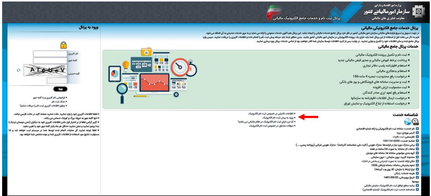
شکل ۳-۱ گام ۱، مرحله ۲

کاربران پس از انتخاب گزینه مذکور وارد صفحه زیر شده و مطابق شکل زیر باید گزینه «ورود به پیش ثبت نام الکترونیک» انتخاب کنند.