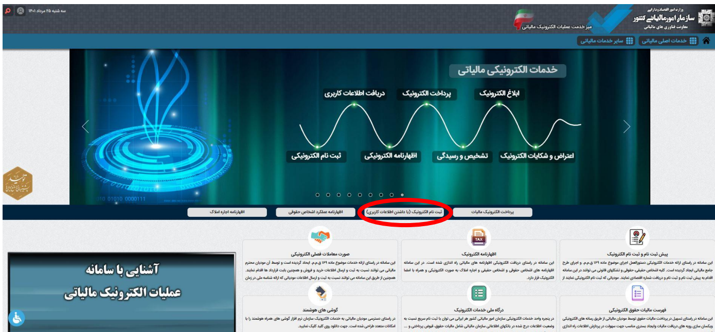
شکل ۲- گام ۱، مرحله ۱

کاربران می‌بایست در ابتدا وارد سایت https://tax.gov.ir شده و مطابق شکل زیر بخش «ثبت نام الکترونیک (با داشتن اطلاعات کاربری)» را انتخاب نمایند.