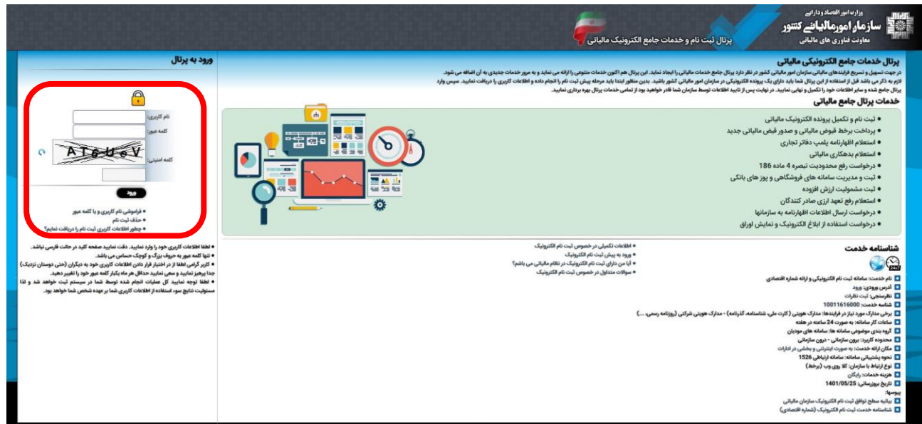
شکل ۴-گام ۱، مرحله ۴

کاربر در این مرحله مجدداً وارد پرتال ثبت نام ( https://register.tax.gov.ir ) شده و با استفاده از نام کاربری و رمز عبور ارسالی به وی، وارد پرتال سازمانی شده و برخی دیگر از اطلاعات درخواستی را می‌بایست تکمیل نماید.